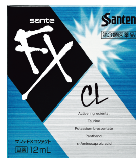
コンタクト装着時の 目の不快感に サンテ FX コンタクト 第3類医薬品