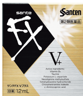
目の疲れに サンテ FX V プラス 第2類医薬品