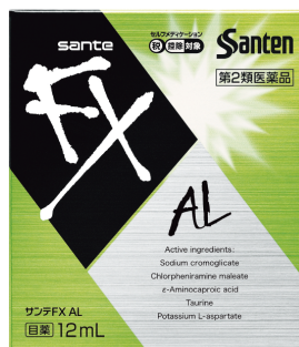
花粉・ハウスダストなどによる 目のかゆみに サンテ FX AL 第2類医薬品