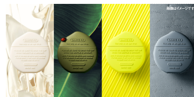
サンテFX × サカナクション オリジナルコラボケースキャンペーン 【応募期間】2021年6月1日～6月27日23:59まで