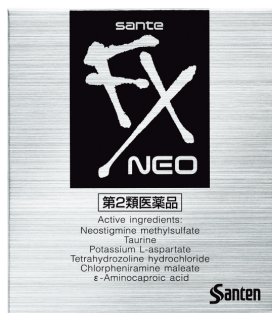
目の疲れに サンテ FX ネオ 第2類医薬品

「サンテ FX シリーズ」では、2021 年 3 月 24 日(水)より、花粉・ハウスダストなどによる目のかゆみに効果を発揮する一般用点眼薬「サンテ FX AL」と、コンタクト装着時の目の不快感に効果を発揮する「サンテ FX コンタクト」の 2 製品を発売し、4 つのラインアップとなりました。これからも、より多くの若者たちのニーズに応えるブランドを目指していきます。