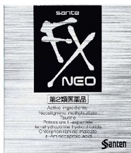
サンテ FX ネオ 目の疲れに

薬「サンテ FXAL」と、コンタクト装着時の目の不快感に効果を発揮する「サンテ FX コンタクト」の2製品を発売し、4つのラインアップとなりました。これからも、より多くの若者たちのニーズに応えるブランドを目指していきます。