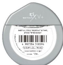
サンテ FX V プラス 目の疲れに