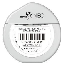
サンテ FX ネオ 目の疲れに