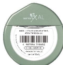
サンテ FX AL 花粉・ハウスダストなどによる 目のかゆみに