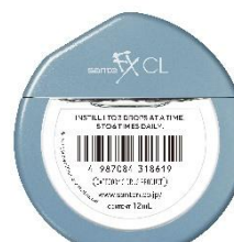
サンテ FX コンタクト コンタクト*装着時の 目の不快感に *カラーコンタクトレンズを除く