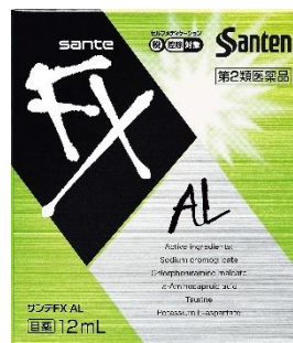
サンテ FX AL 花粉・ハウスダストなどによる 目のかゆみに