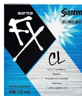
サンテ FX コンタクト コンタクト*装着時の 目の不快感に *カラーコンタクトレンズを除く