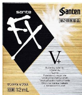
サンテ FX V プラス 目の疲れに